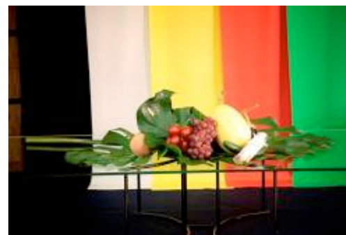
左：江戸手妻 中：浮世絵版画 右：室礼